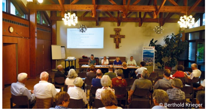
Mitgliederversammlung des Bürgervereins Juni 2024

Liebe Leserinnen und Leser, liebe Mitglieder des Bürgervereins,