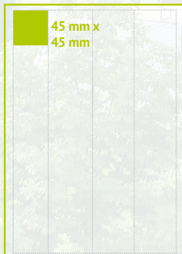
Rubrik – Kleinanzeigen